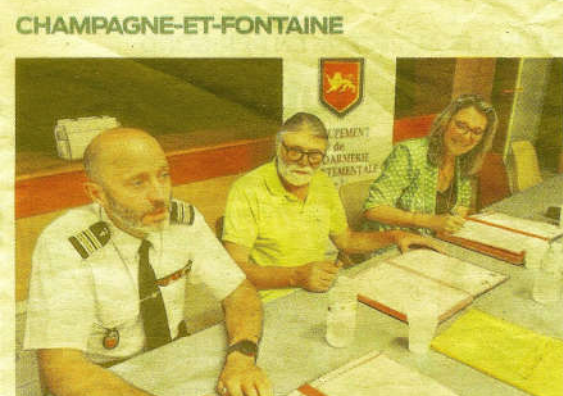
La signature de la convention, jeudi 18 juillet, entre la préfecture, la mairie et la gendarmerie.